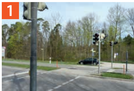
1 Fußgängerampel an der Hochmuttinger Straße / Freisinger Straße