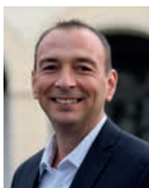
Markus Böck 1. Bürgermeister

Die Herausgeber dieses Schulwegplanes, der Landkreis München und Ihre Wohnsitzgemeinde sowie Ihre Schule und die Elternbeiräte, wünschen allen Schulkindern einen stets unfallfreien Schulweg!