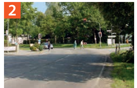
2 Fußgängerampel an der Freisinger Straße / Haselsberger Straße