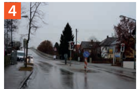
4 Fußgängerampel an der Ludwig-Thoma-Straße / Mittenheimer Straße