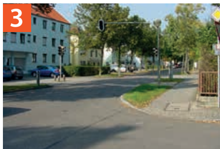
3 Fußgängerampel an der Hofkurat-Diehl-Straße / Mittenheimer Straße