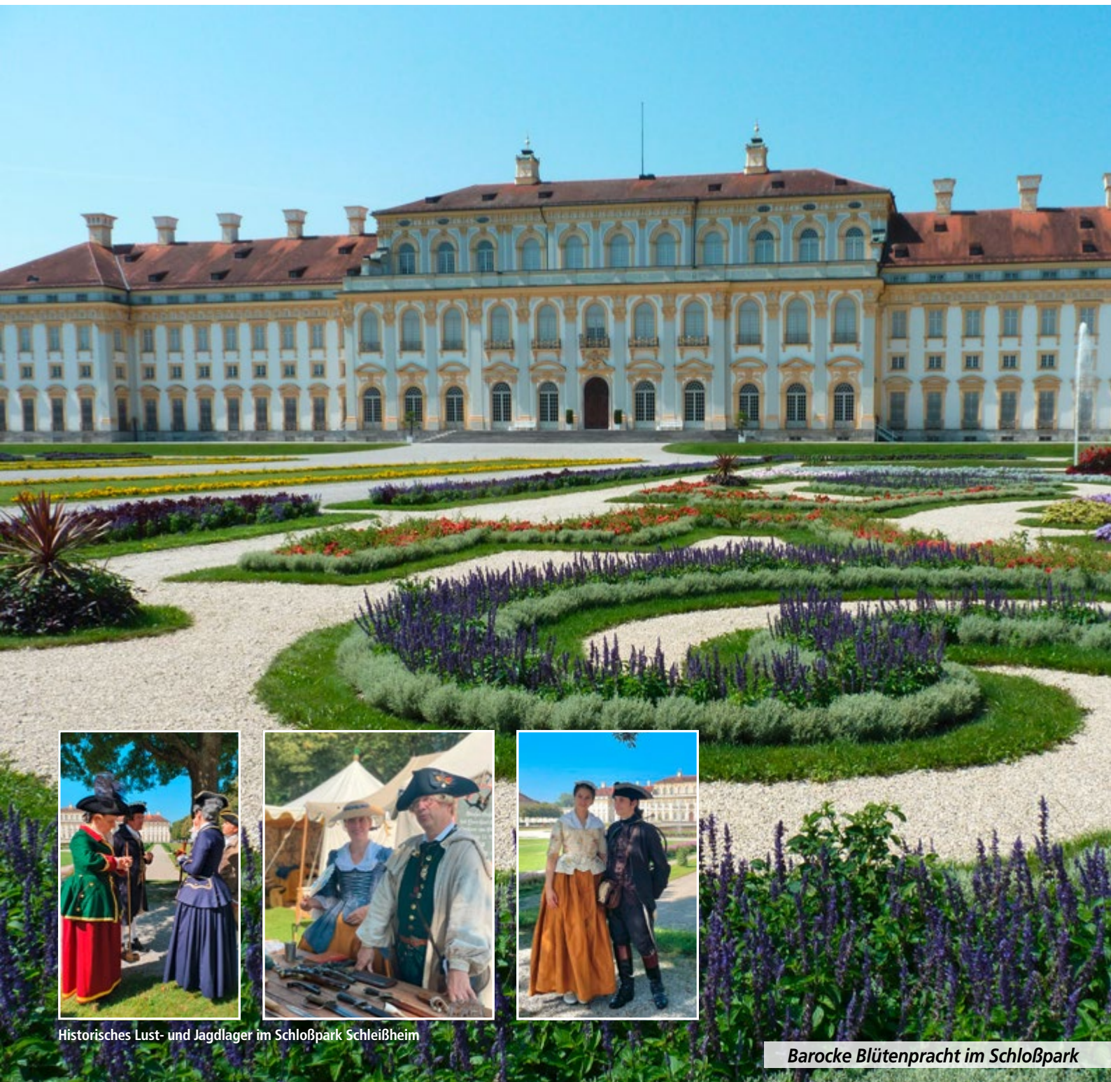
Historisches Lust- und Jagdlager im Schloßpark Schleißheim