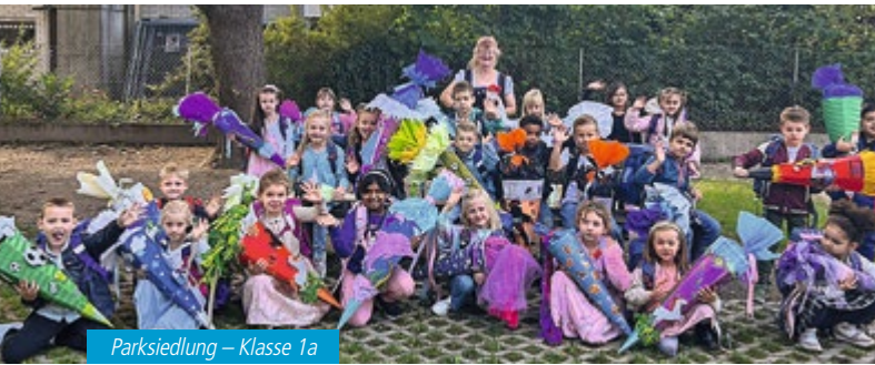
Parksiedlung – Klasse 1a

Der erste Schultag: Mit einer fröhlich-bunten Feier wurden die neuen Erstklässler und ihre Eltern am Dienstag, 16.09.2025, sowohl an der Grundschule in der Parksiedlung als auch in der Berglwaldschule begrüßt. Auch Erster Bürgermeister Markus Böck war an diesem Tag bei beiden Einschulungsfeiern dabei, wünschte Glück und überbrachte kleine Geschenke der Gemeinde und der Bücherei für jedes Schulkind.