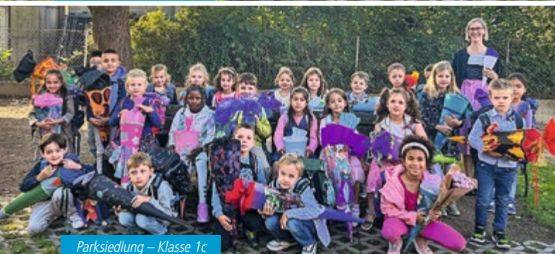
Parksiedlung – Klasse 1c