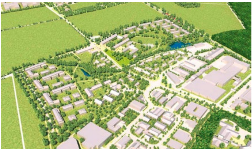
Ansicht des Quartiers Mittenheim