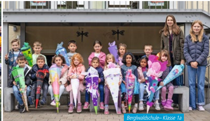
Berglwaldschule – Klasse 1a