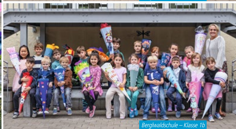
Berglwaldschule – Klasse 1b