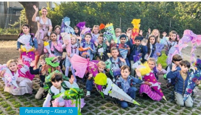
Parksiedlung – Klasse 1b