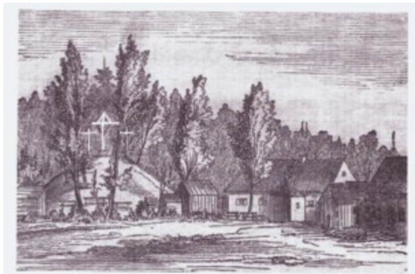
Foto: Ansicht des Kalvarienberges und der ehemaligen St.-Ignatius-Klaus, 1856.

Treffpunkt der Radfahrer ist am 10. Mai der Biergarten beim Alten Schloss Schleißheim um 14.00 Uhr. Die Teilnahmegebühr beträgt (inkl. Informationsmaterial) 3 Euro. Otto Bürger