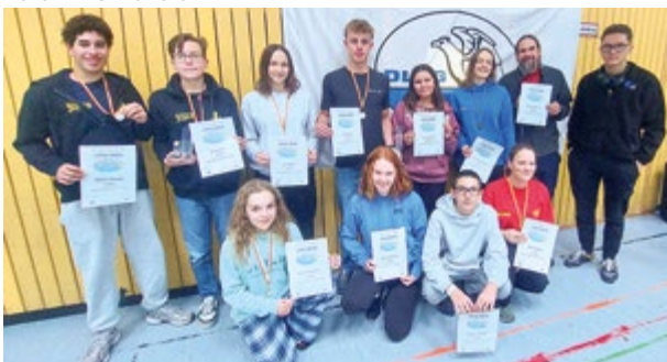
DLRG Oberschleißheim beim 24-Stunden-Schwimmen in Haar

Ein Dank geht an die Organisator*innen, Bahnzähler*innen sowie alle Helfer*innen vor Ort.